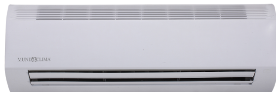
Modèle 71 a 80